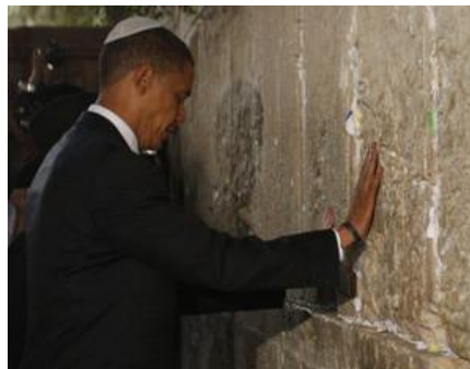
דיפלומטיה, תמרון ותחכום.